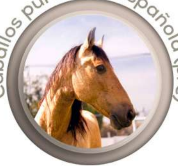
Caballos pura raza española (pre)