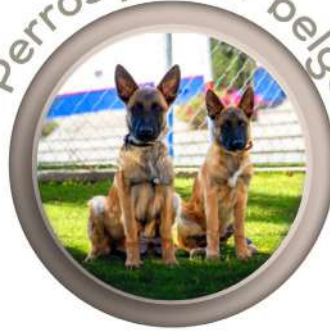
Perros pastor belga