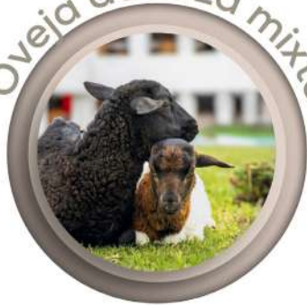
Oveja de raza mixta